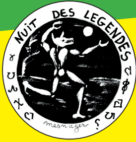
Logo de l'association Nuit des Légendes, créé par Jérôme MESNAGER